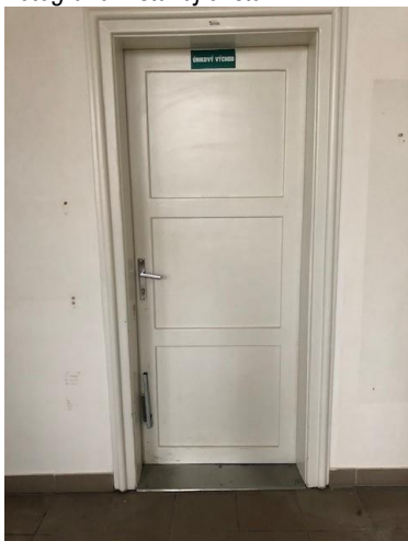
Fotografie – stávající stav