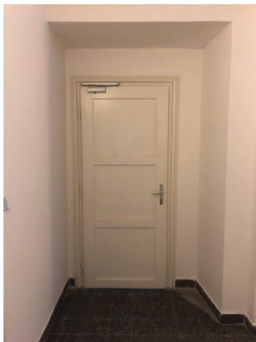
Fotografie – navrhovaný stav (standard provedení)