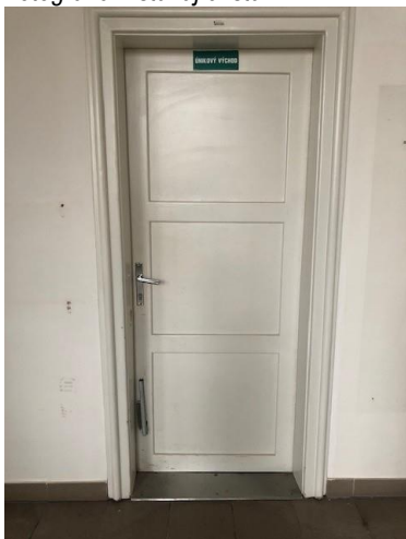
Fotografie – stávající stav