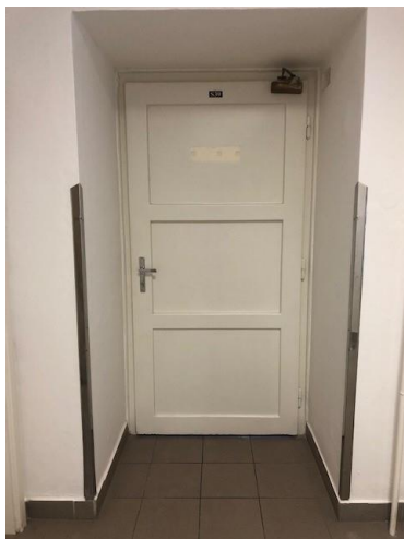
Fotografie – navrhovaný stav (standard provedení)